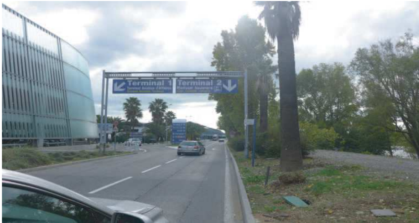
1) Aéroport de Nice Cote D'azur direction Terminal 2 / Nice Airport Azure direction terminal 2