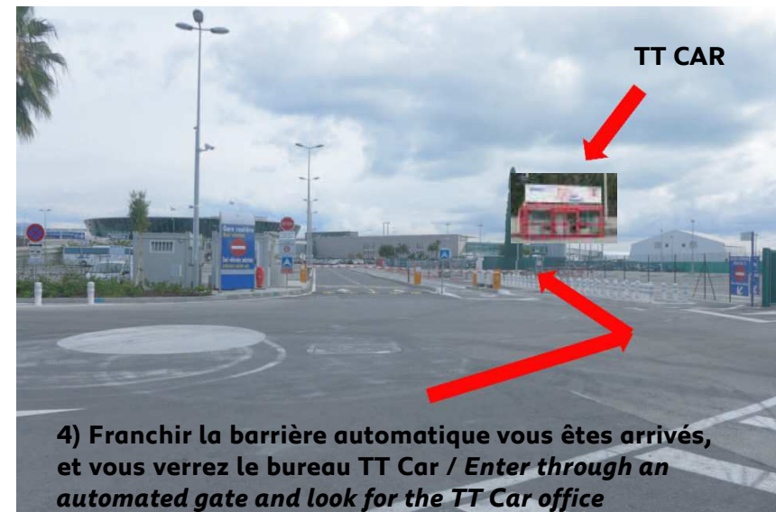
4) Franchir la barrière automatique vous êtes arrivés, et vous verrez le bureau TT Car / Enter through an automated gate and look for the TT Car office