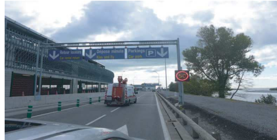
2) Suivre Parkings restez sur la droite / Follow Parking keep right