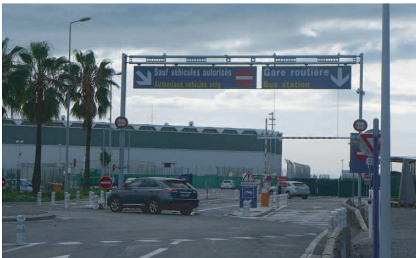
3) Suivre la direction Gare routière / Enter the restricted area "Bus station"